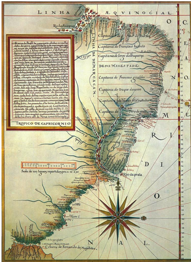
Figure 3 : Roteiro de todos os sinaes conhecidos, fundos, baixos, Alturas, e derrotas, que ha na Costa do Brasil desde cabo de São Agostinho até o estreito de Fernão de Magalhães » - carte de Luís Teixeira (c. 1574) – Biblioteca da Ajuda, ms. 51-IV-38 in https://brasilhis.usal.es/es/cartografia/mapa-de-luis-teixeira-roteiro-de-todos-os-sinaes

L'attention aux frontières « tirées à la règle » et souvent rencontrées en Amérique, permet la mise en perspective de l'utilisation de la carte comme support d'une action de conquête, combien serait-elle encore basée sur des connaissances sommaires du terrain. Le souci d'appropriation initié par l'affectation de noms issus de traditions catholiques européennes (noms de saints) et d'autres intérêts économiques (rio da prata – la rivière de l'argent), révèle les conditions de surimposition de nouvelles logiques par rapport au contexte et dénominations locales.