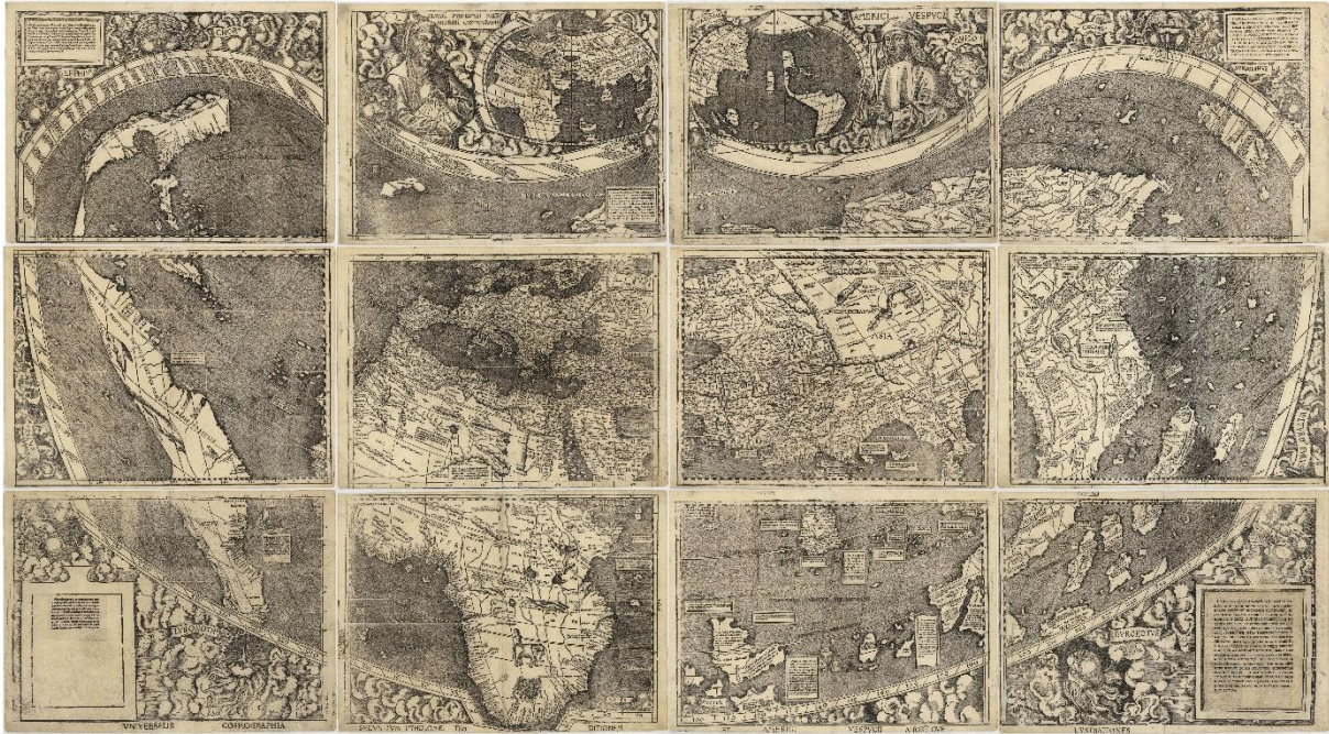
Figure 1 : Le planisphère de Martin Waldseemüller de 1507 – exemple emblématique de mise en valeur d’une carte historique https://www.loc.gov/resource/g3200.ct000725