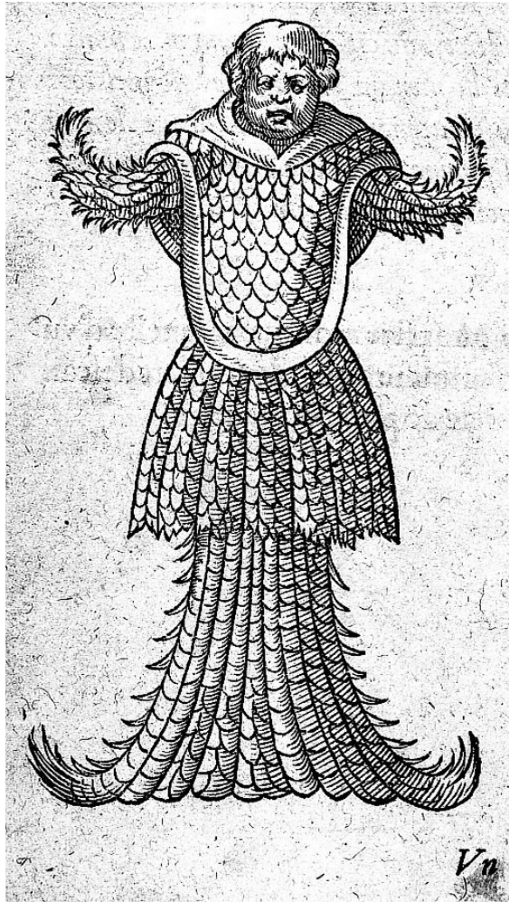
Monstre marin tiré de l'ouvrage de Guillaume Rondelet – 1555