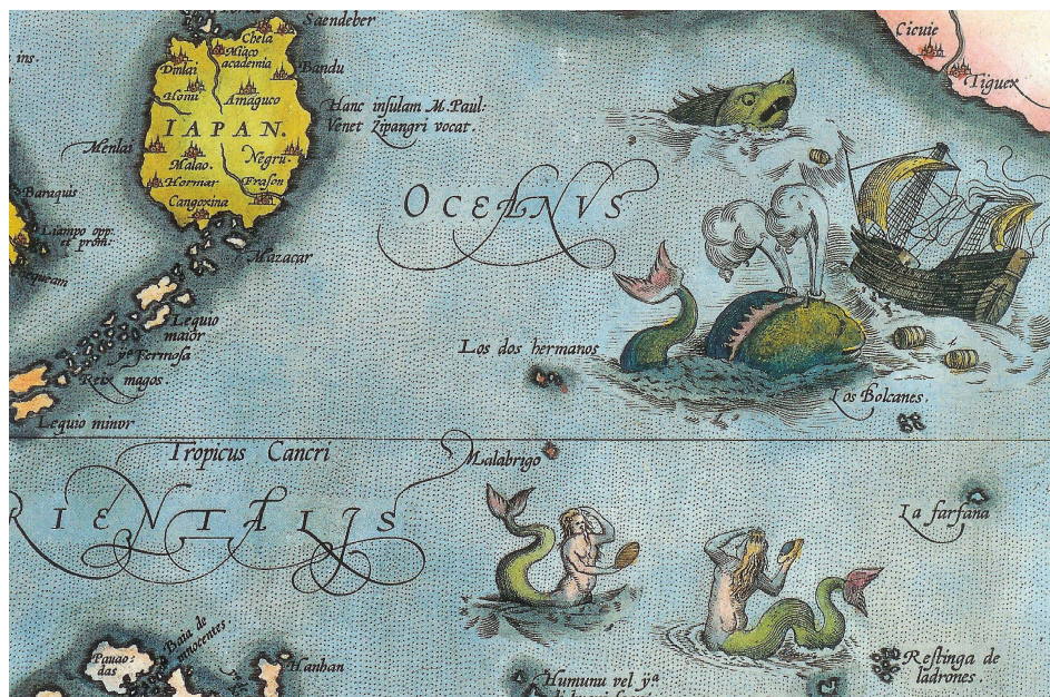
Sirènes – Carte de 1574 tirée de l'ouvrage de Abrahamus Ortelius

VOISENET, Jacques, Bêtes et Hommes dans le monde médiéval. Le bestiaire des clercs du V e au XII e siècle , Thurnhout, Brepols, 2000.