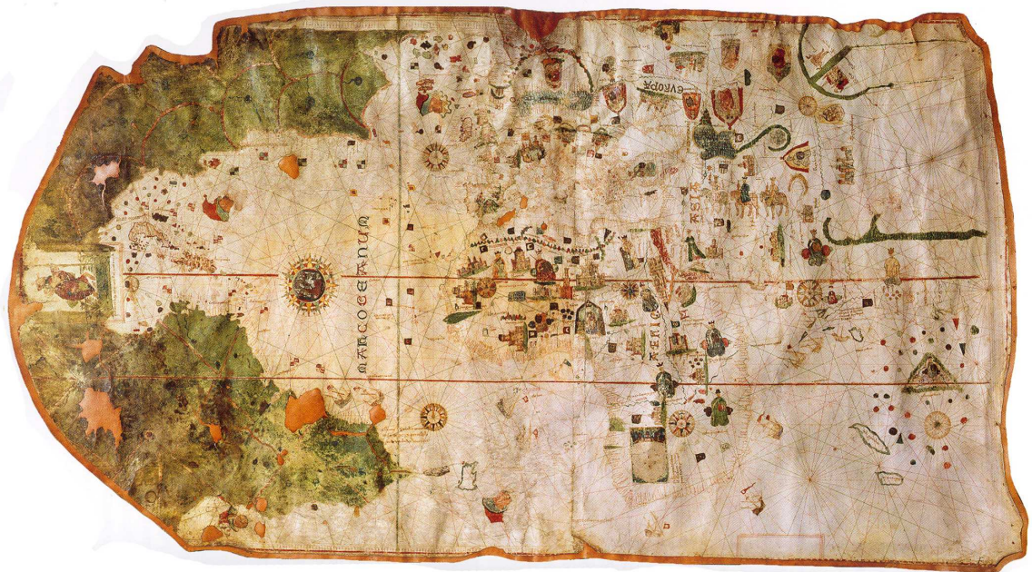
Carte de Juan de la Cosa datant de 1500