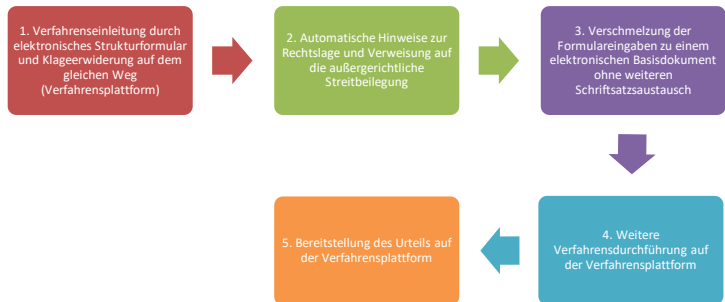
Abbildung 2: Ablaufskizze eines Online-Bagatellverfahrens/ Dérroulement possible d'une procédure dématérialisée des petits litiges