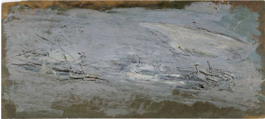
Fig.4. Ignacio Pinazo Camarleny, Barcas en blanco , s.f., IVAM (Instituto Valenciano de Arte Moderno)