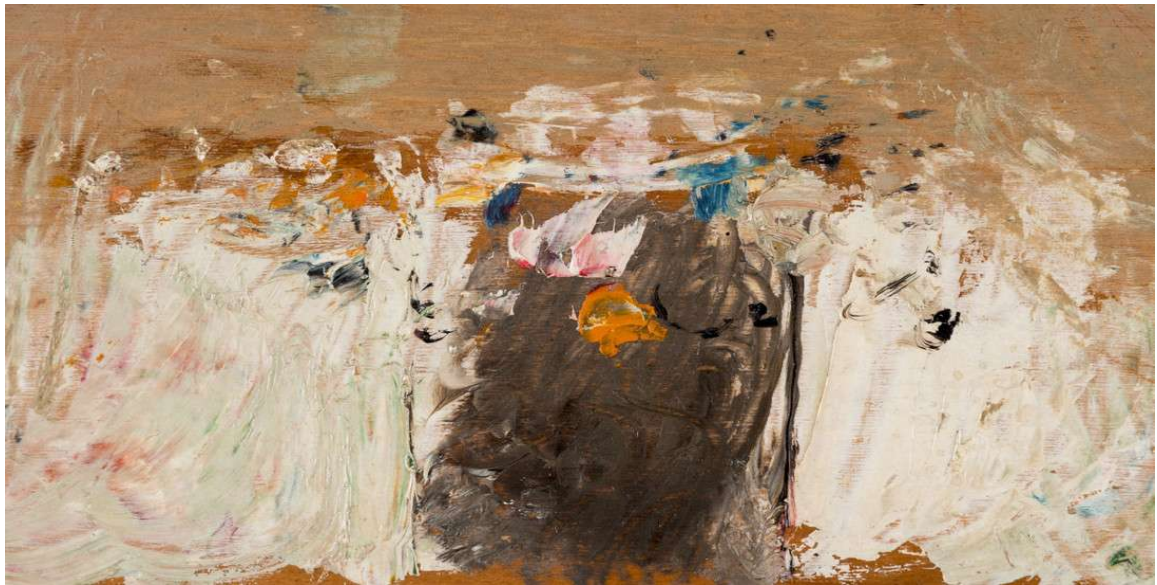
Fig.2. Gente a la entrada de un edificio, s.f.