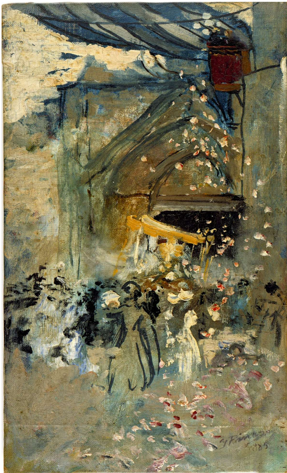
Fig.1. Ignacio Pinazo Camarlench, La procesión del Corpus, 1885, Casa-Museo de Godella. Valencia.