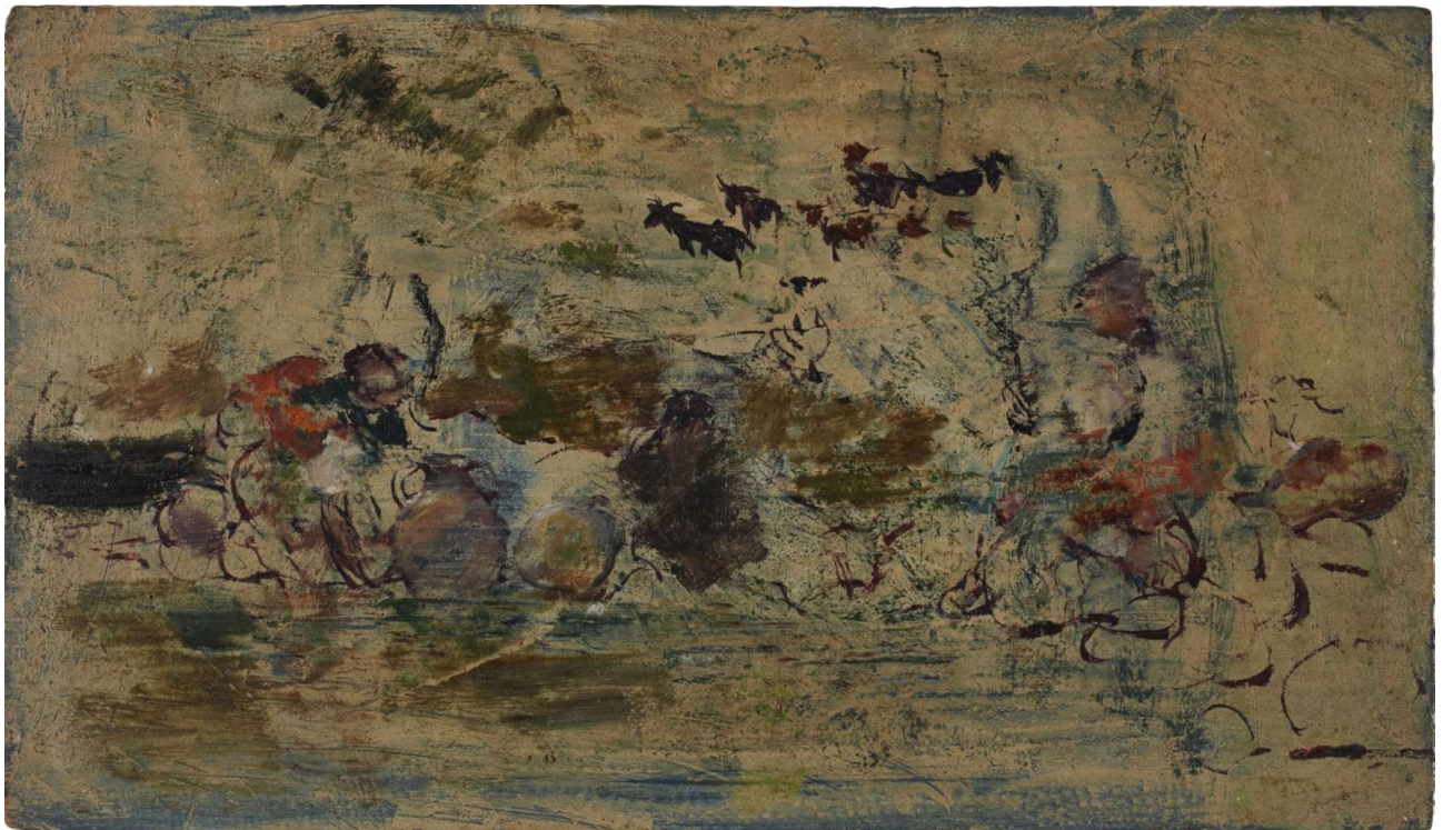
Fig.5. Ignacio Pinazo Camarlench, Lecheras , 1910, IVAM (Instituto Valenciano de Arte Moderno)