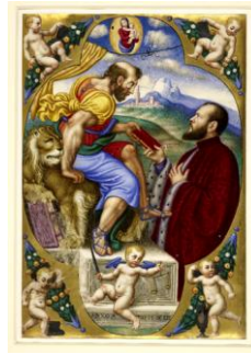
Fig. 6 : BL, Add. 20916, f.11

Ces commissions appartiennent à la troisième phase que nous avons décrite au début de cette étude, quand l'image envahit la totalité de la page (voir fig. 3) mais il est vrai que la même touche semble se retrouver dans la fig.3 que dans les fig.5 et fig.6. C'est le même saint Marc, jeune et barbu mais nettement plus musclé, ce sont les mêmes drapés mais plus sculpturaux et plus vigoureux suivant l'évolution de la peinture maniérisme vers les prémisses du baroque sous l'influence du goût toscan-romain qui est introduit à Venise par Pordenone ou Tintoret. C'est le même encadrement quadrilobé, ce sont les mêmes paysages avec la silhouette de la ville de destination du commissionné, c'est la même composition en diagonale tracée par les regards intenses, ce sont les mêmes tons où dominent les rouges éclatants et le lumineux bleu lapis lazuli.