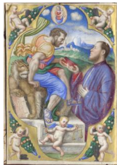
Fig. 5 : BMCV III/140

Lors de cette première recherche pour attribution, il m'a été donné de voir une autre commission ducale de la seconde moitié du XVI e siècle, celle du doge Francesco Donà à Giovanni Antonio Venier pour la magistrature de podestat 26 de Cittadella (bourgade fortifiée de Vénétie) dont l'enluminure est attribuée à ce miniaturiste qui signe T o .Ve mais datée de 1550 (fig. 5). D'ailleurs, les travaux de Giulia Maria Zuccolo Padrono nous le signale actif jusque dans les années 1580. Par ailleurs, deux commissions, l'une conservée à la British Library de Londres (fig.6) et l'autre à la Free library Lewis de Philadelphie (ms 4719) reprennent à l'identique la composition de la fig. 5 en invoquant la même attribution à T o .Ve . On notera que ces enluminures ayant été détachées de la commission , on ignore désormais leurs attributions.