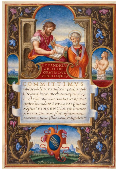
Fig. 4 : Cambridge, Fitzwilliam museum, Morlay Cutting, It. 43