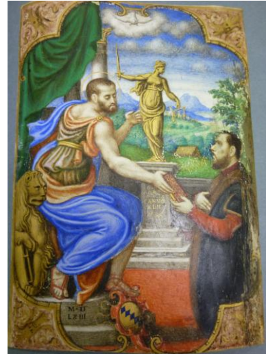
Fig. 3 : BOU ms 50