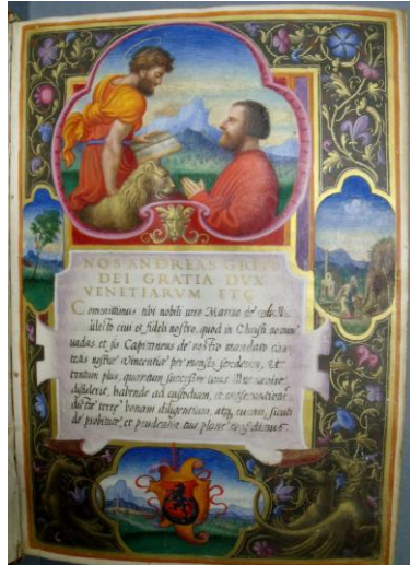
Fig. 2 : BOU ms 14