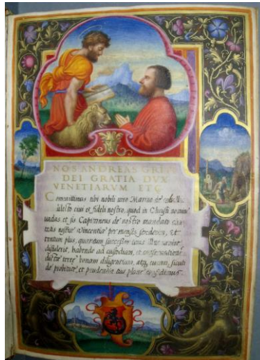
Fig. 2 : BOU ms 14