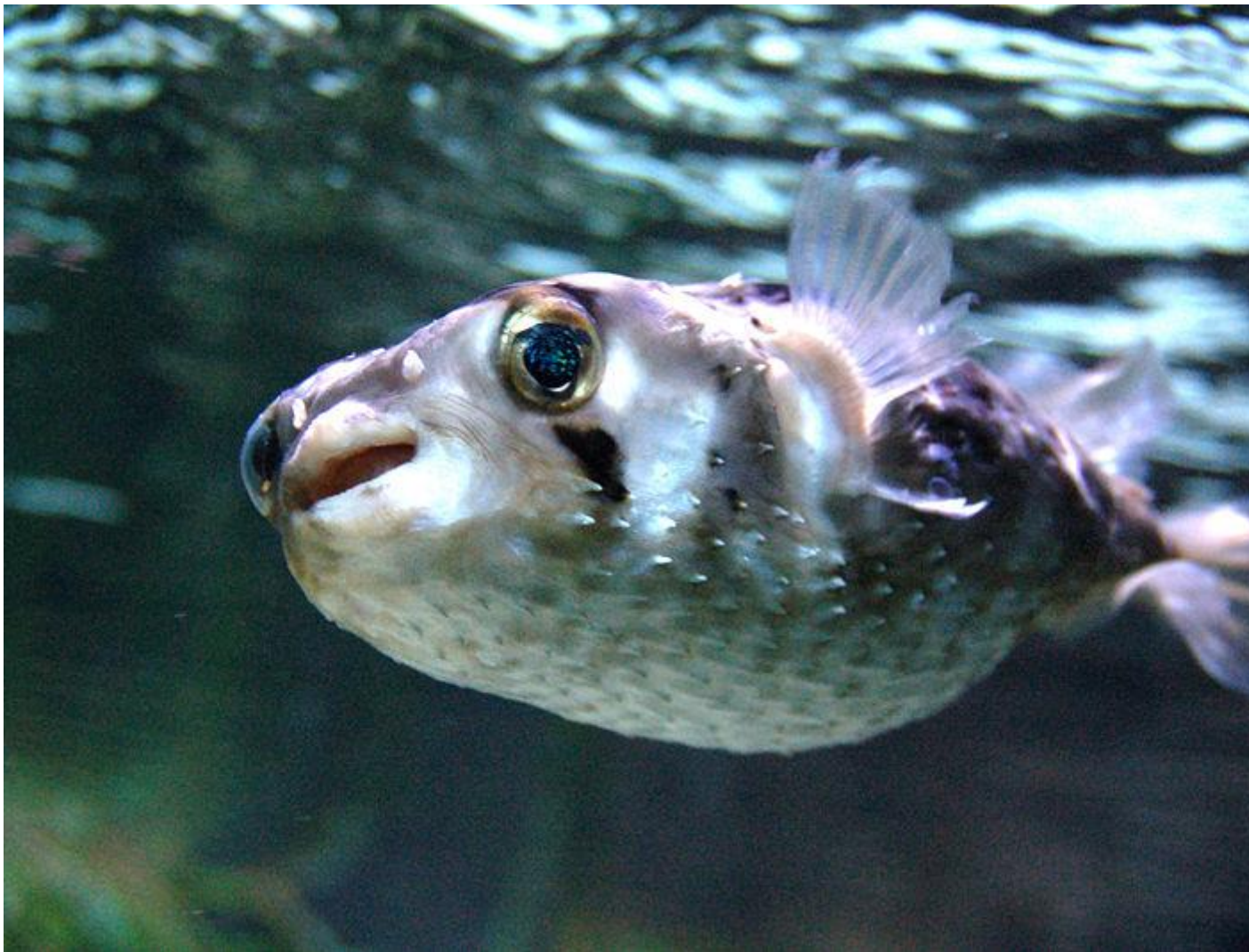
Fig. 1 Poisson porc-épic ( Diodon nictemerus )