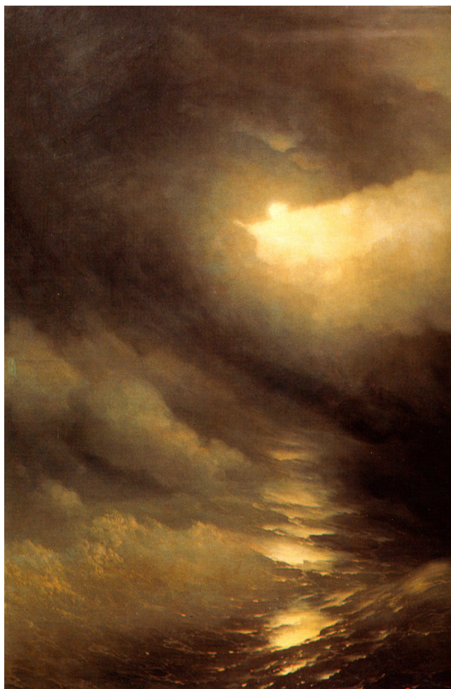
FIG. 6 – Infini vertical, expérience transcendante : Ivan Aïvazovsky, La Création du monde , 1864. Musée d'État Russe, Saint-Pétersbourg.

à tout l'univers et à tous les êtres qui le composent) en tant même que transcendant, c'est-à-dire en tant que l'univers n'existe et de subsiste que par lui. »