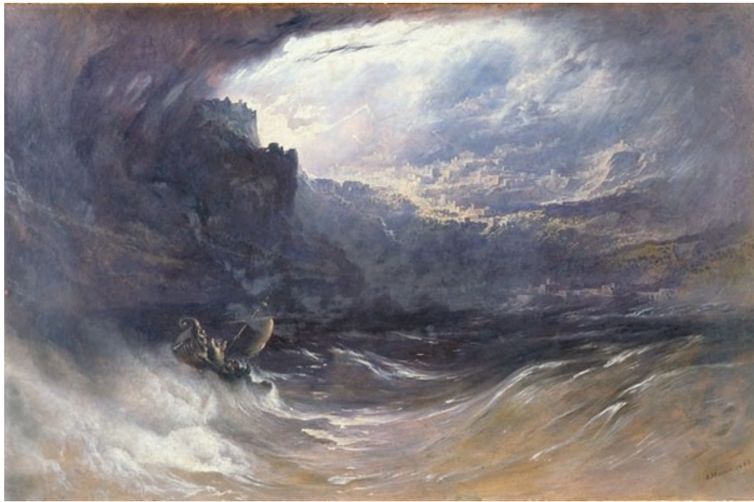
FIG. 2 – Représentation de la dimension verticale de l’infini de la mer : John Martin, Le Christ apaisant la tempête , 1852. York Art Gallery.

son caractère infini. L’image de la mer chargée de sens dévoilera l’invisibilité de son infinitude en utilisant son espace comme point d’intersection d’entrées multiples.