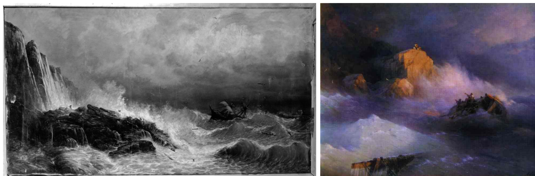
FIG. 8 – Infini vertical, expérience existentielle de naufrage contemplé : Rafael Monleón y Torres (figure à gauche), Naufrage sur la côte d'Asturie , 1876. Musée du Prado, Madrid; Ivan Aïvazovsky (figure à droite), Naufrage , 1876. The Aivazovsky Art Gallery, Feodosia, Ukraine.