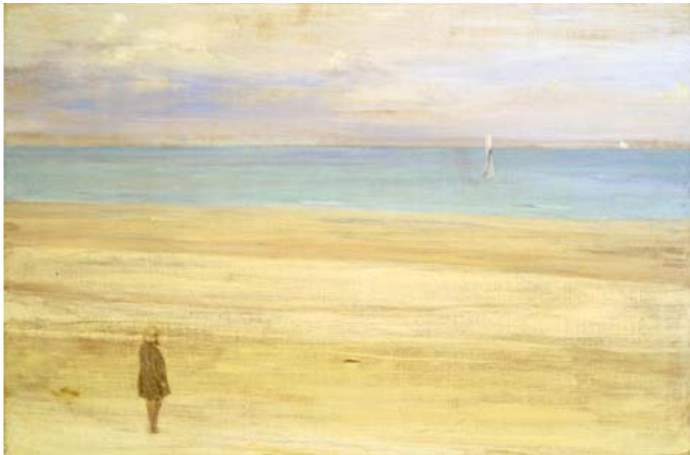
FIG. 4 – Infini horizontal, expérience visuelle : James McNeill Whistler, Harmonie dedans bleu et argent : Trouville , 1865. Isabella Stewart Gardner Museum, Boston.