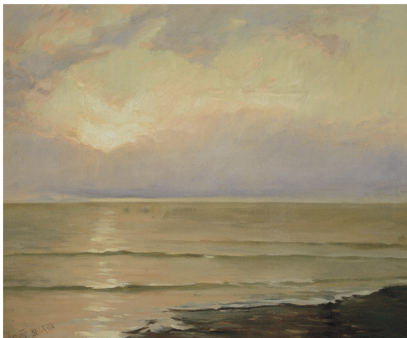
FIG. 9 – Infini horizontal, expérience visuelle : Antonio Muñoz Degraín, Coucher du soleil . Musée du Prado, Madrid.

sur l'expérience de chute et d'immersion de celle-ci en se servant pour cela de l'imagination poétique que l'élément marin leur inspirait. À partir de l'orientation métaphysique que nous avons voulu donner à notre étude, nous préfigurons dans la dimension verticale de l'infini marin recherché par nos artistes, la verticalité descendante, liée à la notion de profondeur en séparant de cette manière le sens transcendant relié à Dieu que nous ne trouvons pas dans les oeuvres analysées. Par contre, le signe ascendant, lié à la transcendance n'a pas été traité dans leur production iconographique.