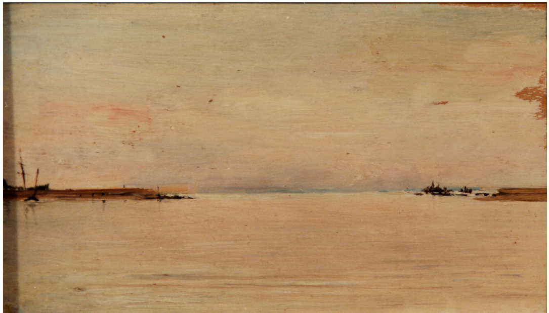
FIG. 5 – Infini horizontal, expérience du voyage : Ignacio Pinazo Camarlench, Port , s.d. Colección Esperanza Pinazo, Vda. de Casar, Madrid.