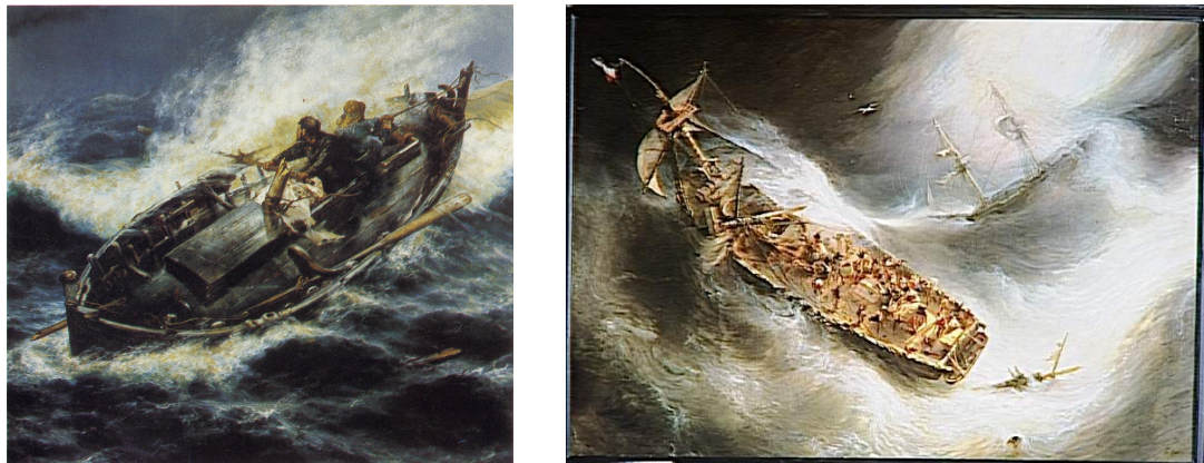
FIG. 7 – Infini vertical, expérience existentielle de naufrage vécu : Salvador Abril Blasco (figure à gauche), À la deriva (détail), 1888. Musée des Beaux-Arts San Pío V, Valencia ; Théodore Jean Antoine Gudin (figure à droite), Trait de dévouement du capitaine Desse, de Bordeaux, envers Le Colombus, navire hollandais , 1831. Musée des Beaux-Arts, Bordeaux.