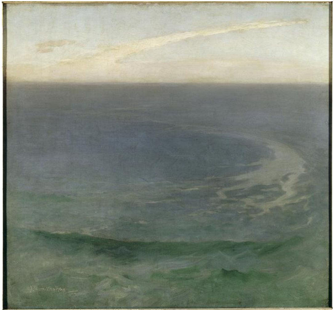
FIG. 1 – Représentation de la dimension horizontale de l’infini de la mer : James Hamilton Hay, Marine , 1897. Musée des Beaux-Arts, Brest.

dire que l’espace devient spatialité et qu’il se constitue de cette manière pour nous. C’est à dire que c’est nous qui le remplissons, qui le divisons et le superposons et le multiplions, et nous essayons même de lui donner cohérence et corps par différents moyens. Appliqué au milieu marin, à son horizontalité et du point de vue de la perspective de la représentation, nous soutenons que dans son espace peuvent apparaître différents champs d’intersection qui nous rapprochent ou nous éloignent des différents phénomènes qui conduisent à la création d’espaces divers chacun avec un sens propre.